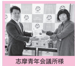
志摩青年会議所様