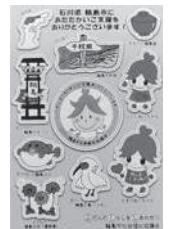
輪島市社協作成 たすけあいちゃん シール