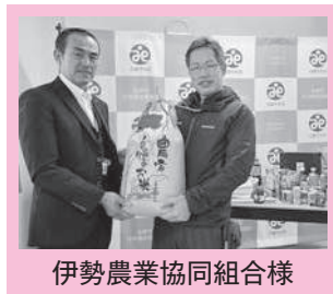
伊勢農業協同組合様