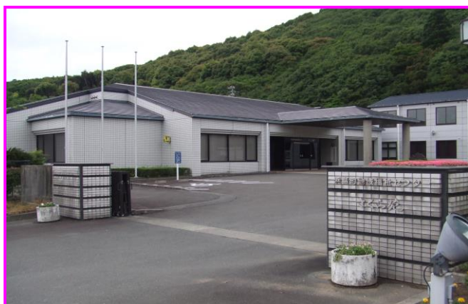
さくら苑（浜島支所内）