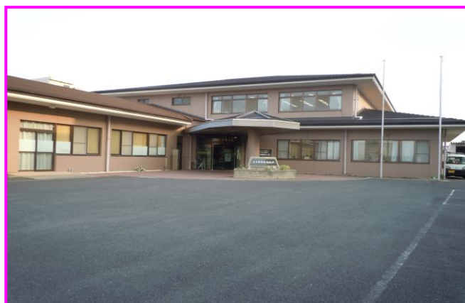
ゆうゆう苑（大王支所内）