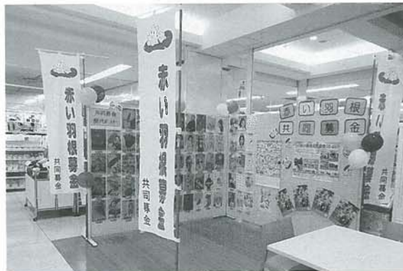
イオン阿児店で啓発