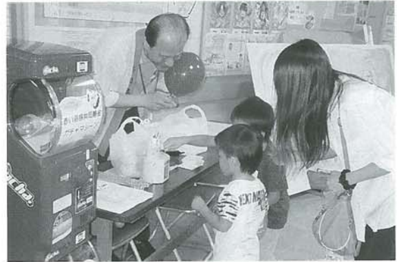
病院まつりで呼びかけ