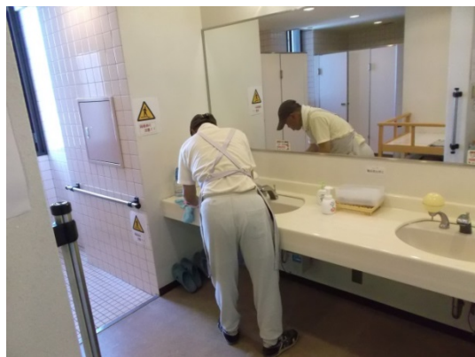
館内清掃活動 (サンライフあご)