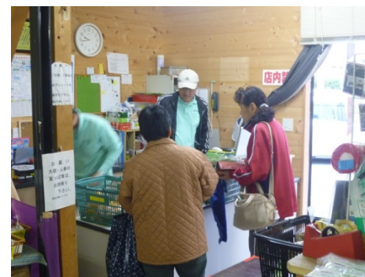
商品販売活動 (市内、移動販売)