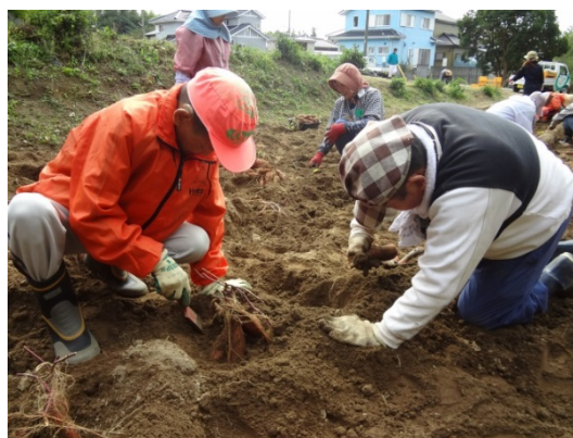
農園作業 (市内農園)