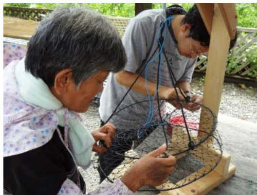
牡蠣籠の修繕 (はばたき、自宅)