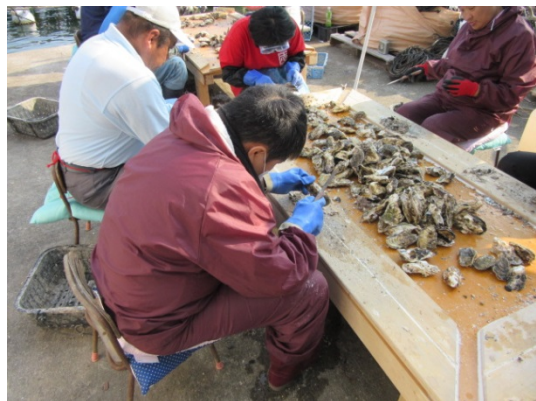
牡蠣掃除など (的矢牡蠣養殖場)