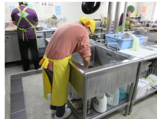
飲食店での作業 (味処はばたき、味工房ともやま)