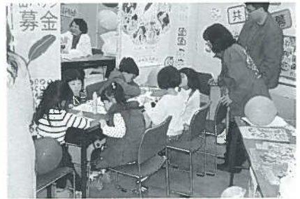
地域福祉フェスタ