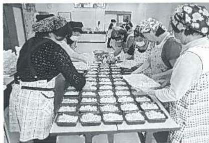
見守り配食サービス