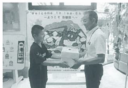
浜島小学校より、素敵な笑顔と一緒に義援金を預かりました♪

161,205円を 熊本県共同募金会へ送金しました。 (6月1日~7月31日分)